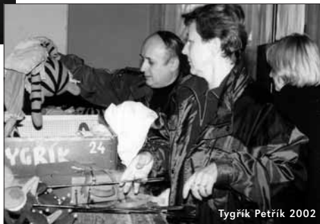
Tygřík Petřík 2002

V nedávné době oslavil pan doktor Blaha významné životní jubileum, ke kterému mu poblahopřál i ministr