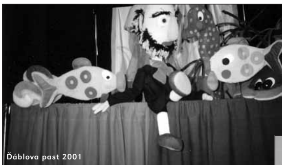
Ďáblova past 2001

principálem amatérského souboru, jeho kmenovým autorem, režisérem, ale i scénografem, technologem a návrhářem loutek. Pod jeho vedením soubor sedmkrát postoupil na největší přehlídku loutkového divadla v České republice, kterou je