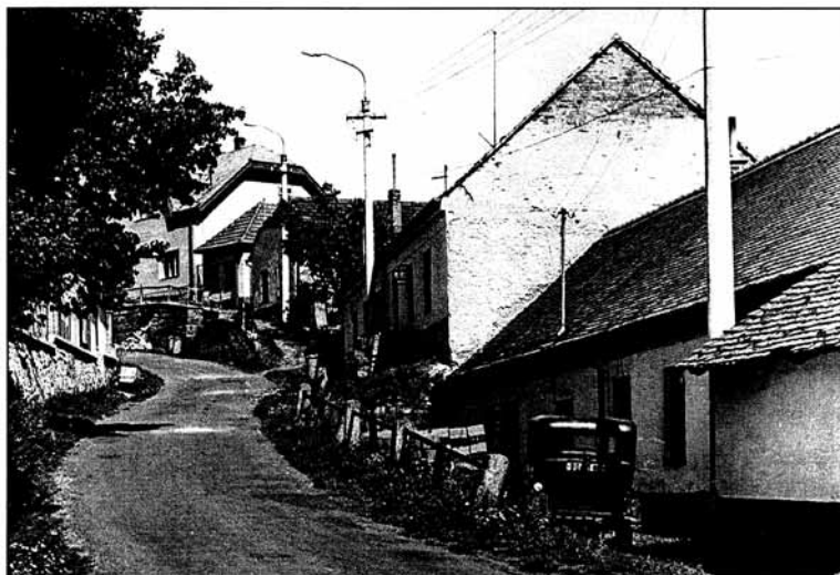
Zmizelé domky – 1969