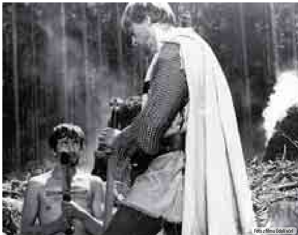
Foto z filmu Údolí včel